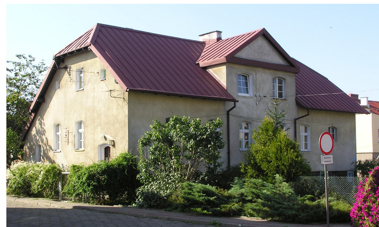
Współczesny wygląd budynku Stacji.