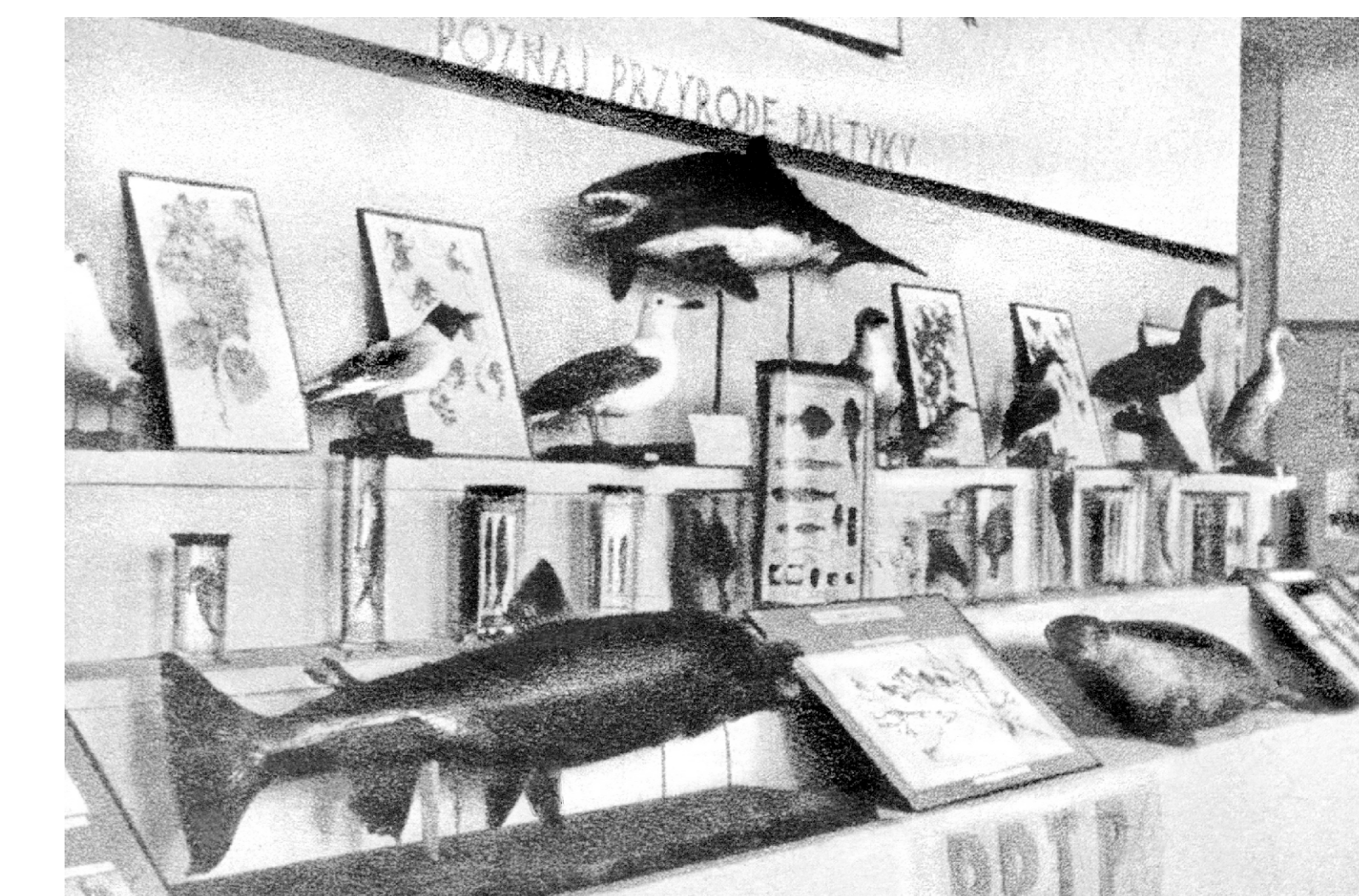
Zbiory Stacji Morskiej na wystawie Morsko - Dydaktycznej w Warszawie, 1935