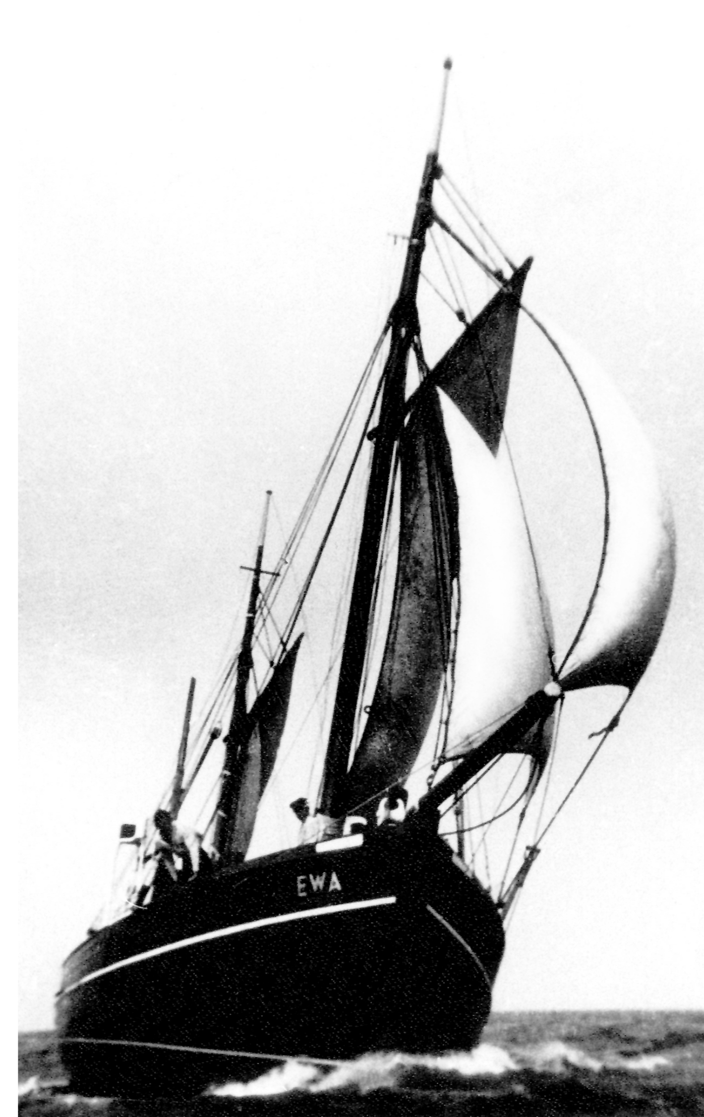
Kuter badawczy Ewa.