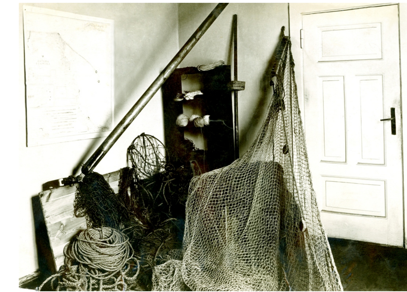
Wnętrze ekspozycji w nowej siedzibie Muzeum Stacji Morskiej - narzędzia rybackie.