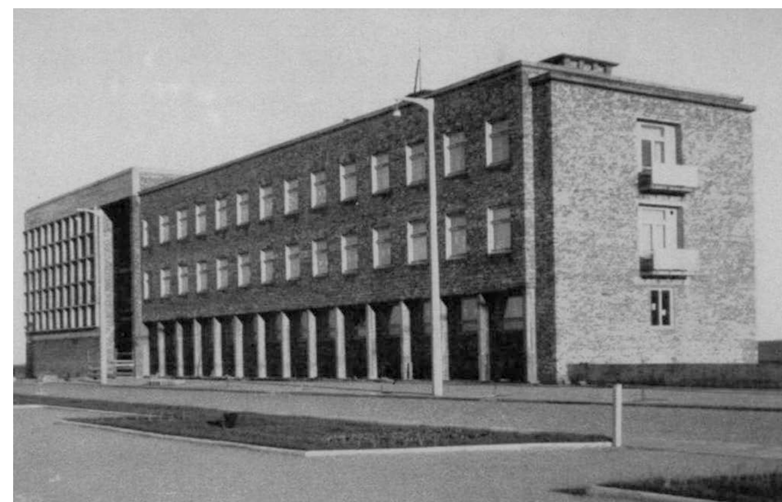
Stacja Morska w Gdyni