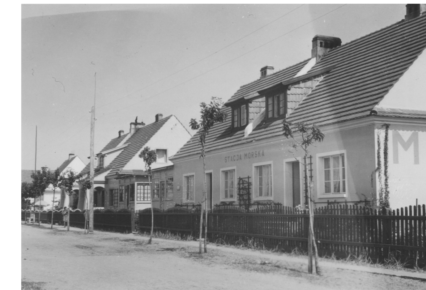
Muzeum Stacji Morskiej w Helu.