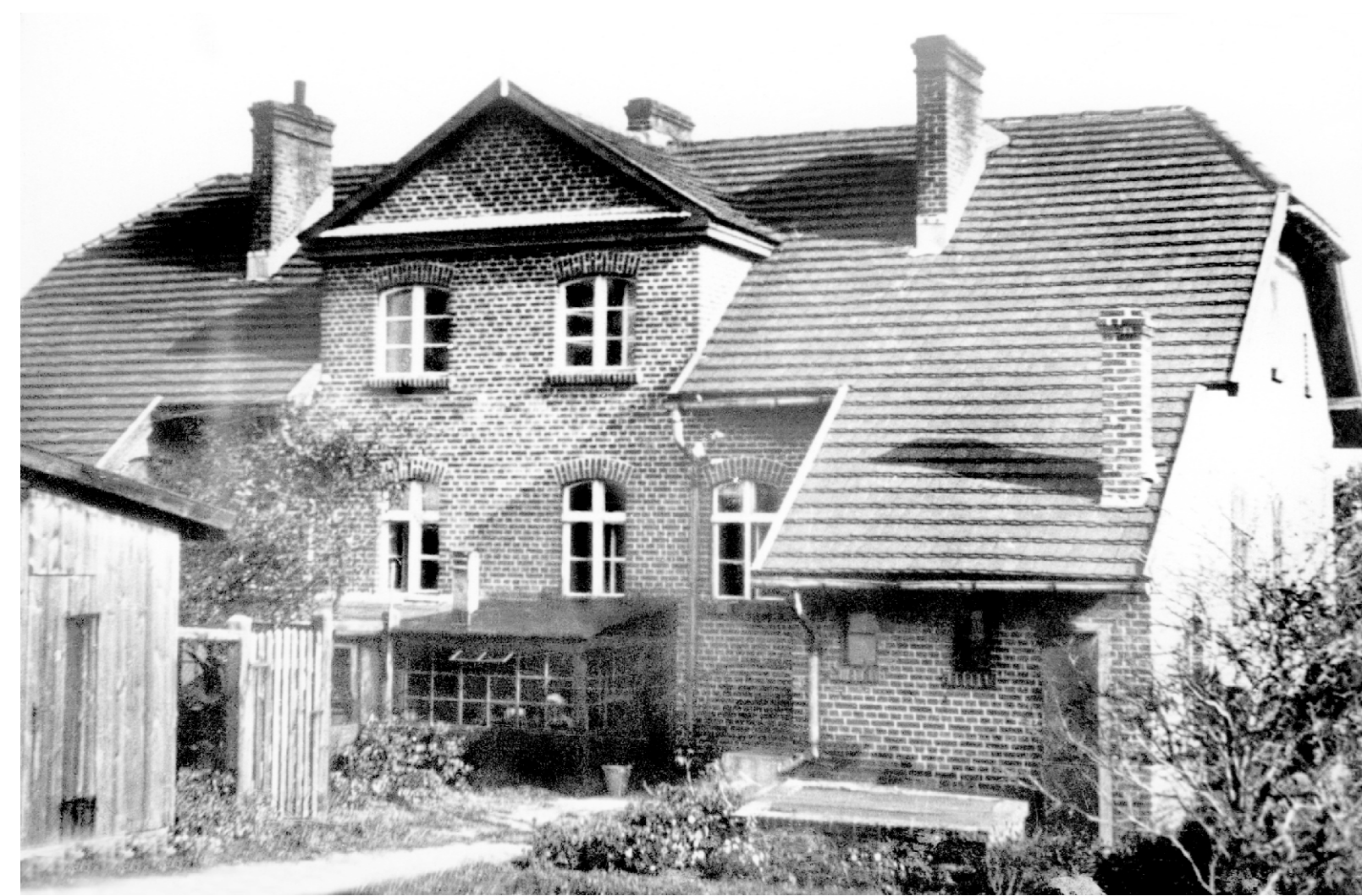
Widok budynku, mieszczącego Morskie Laboratorium Rybackie i Stację Morską w Helu od strony zatoki.