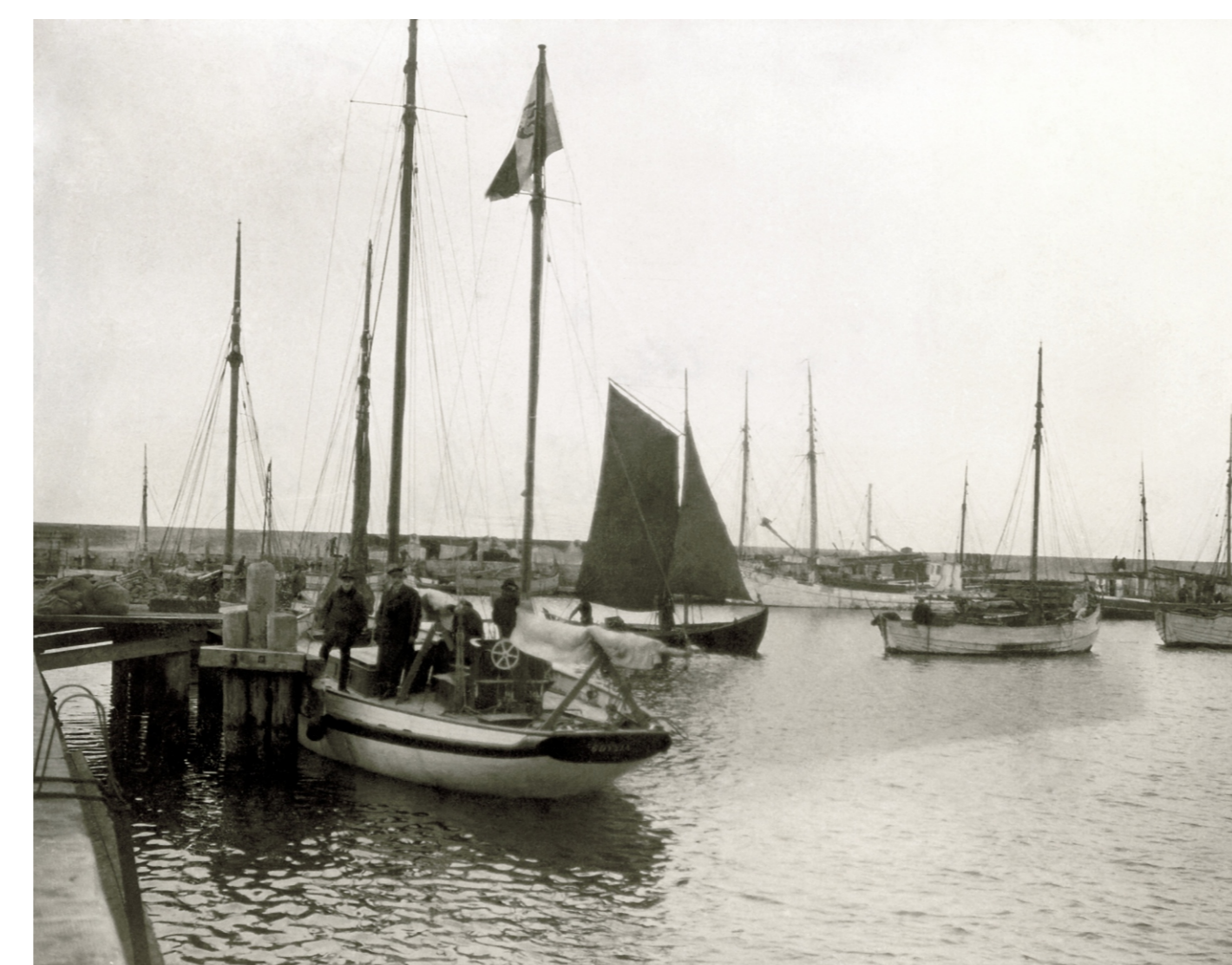
Kuter dozorczy Gazda w porcie helskim, w głębi kuter badawczy Ewa. Rok 1935.