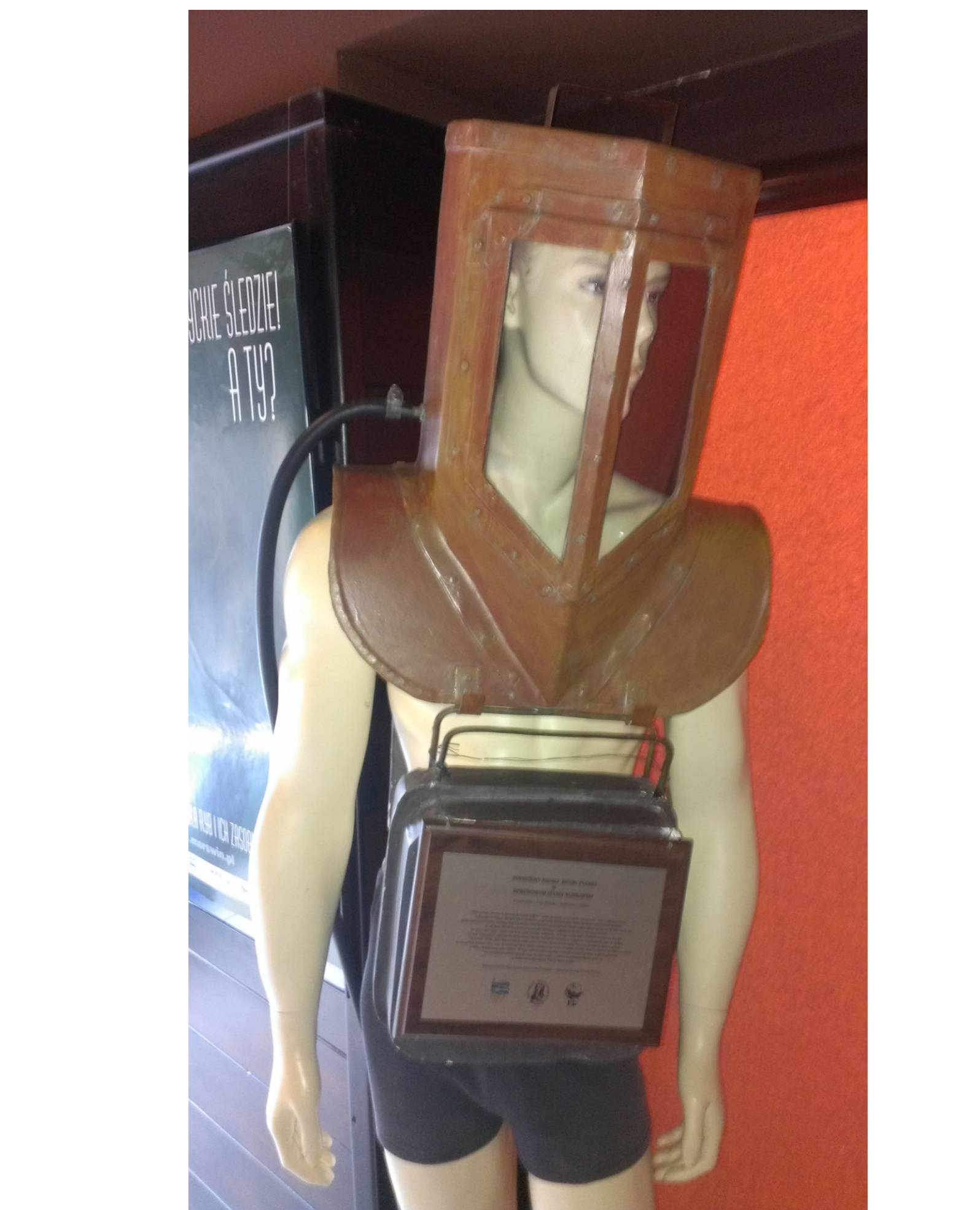
Podwodny badacz w helmie nurkowym projektu prof. J. Wojtuśiaka, 1935.