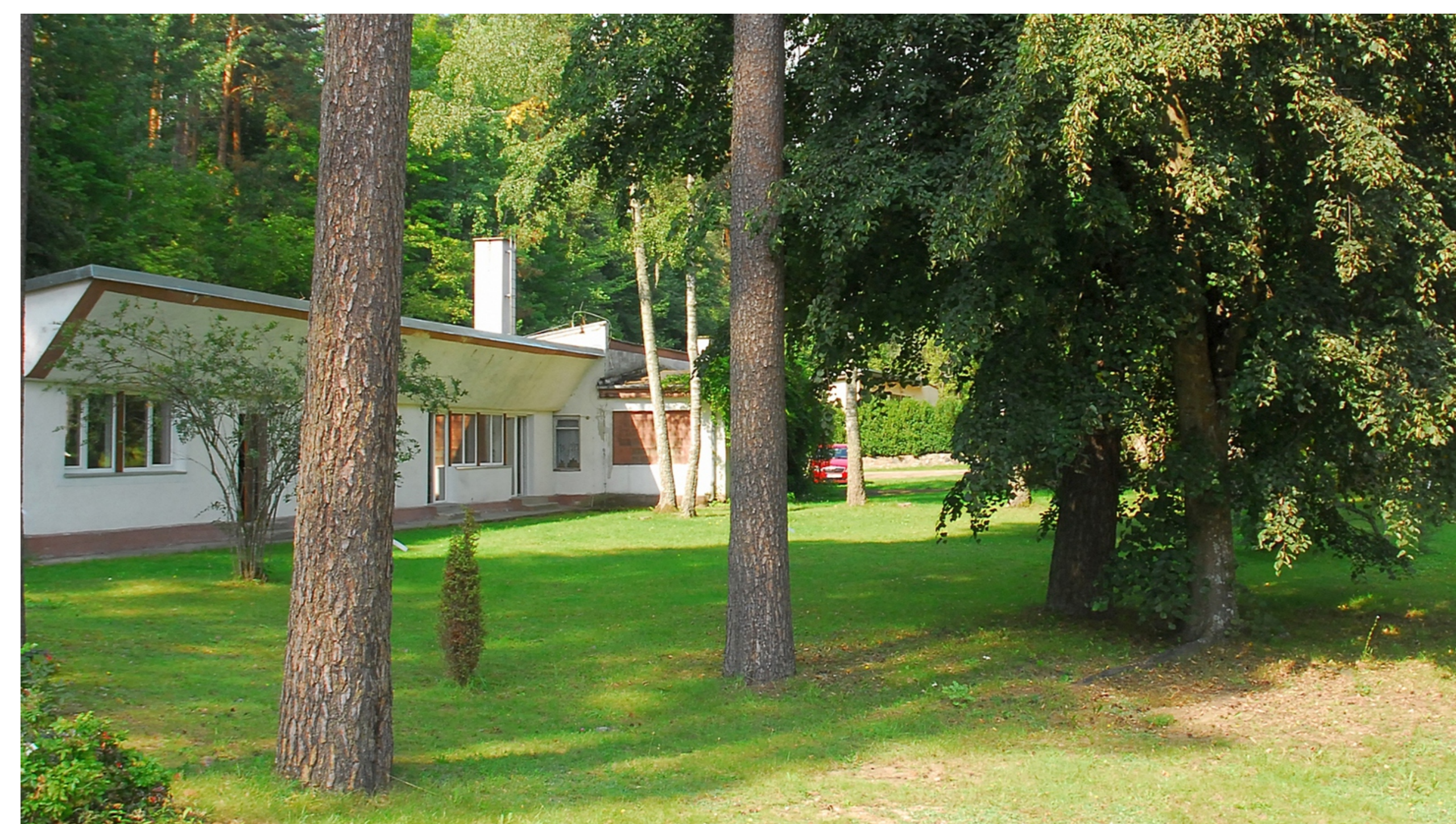
9. Budynek edukacyjny