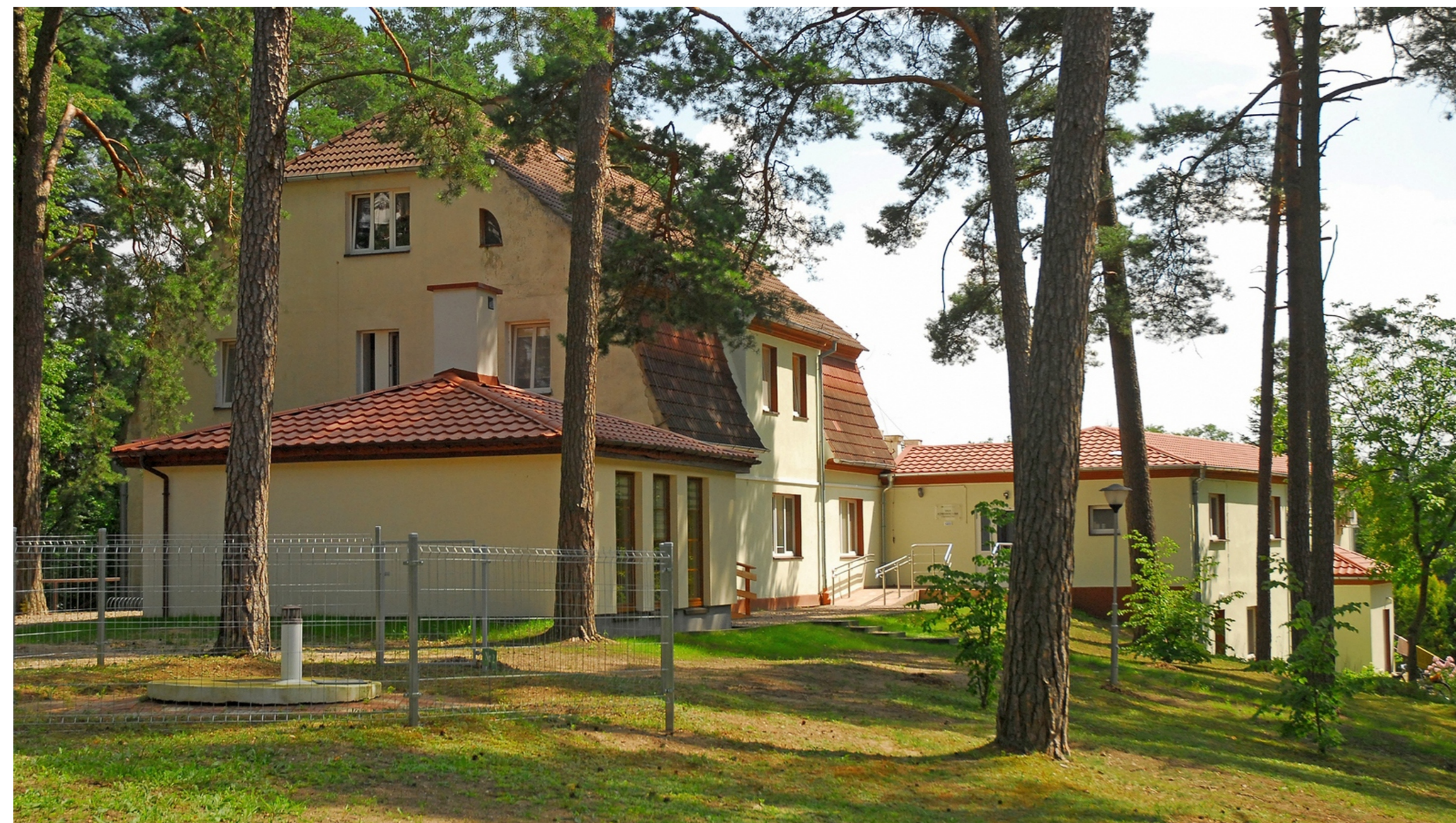
3. Budynek „Poniemiecki”; 4. Studio „Pralnia”; 7. Sala wykładowa