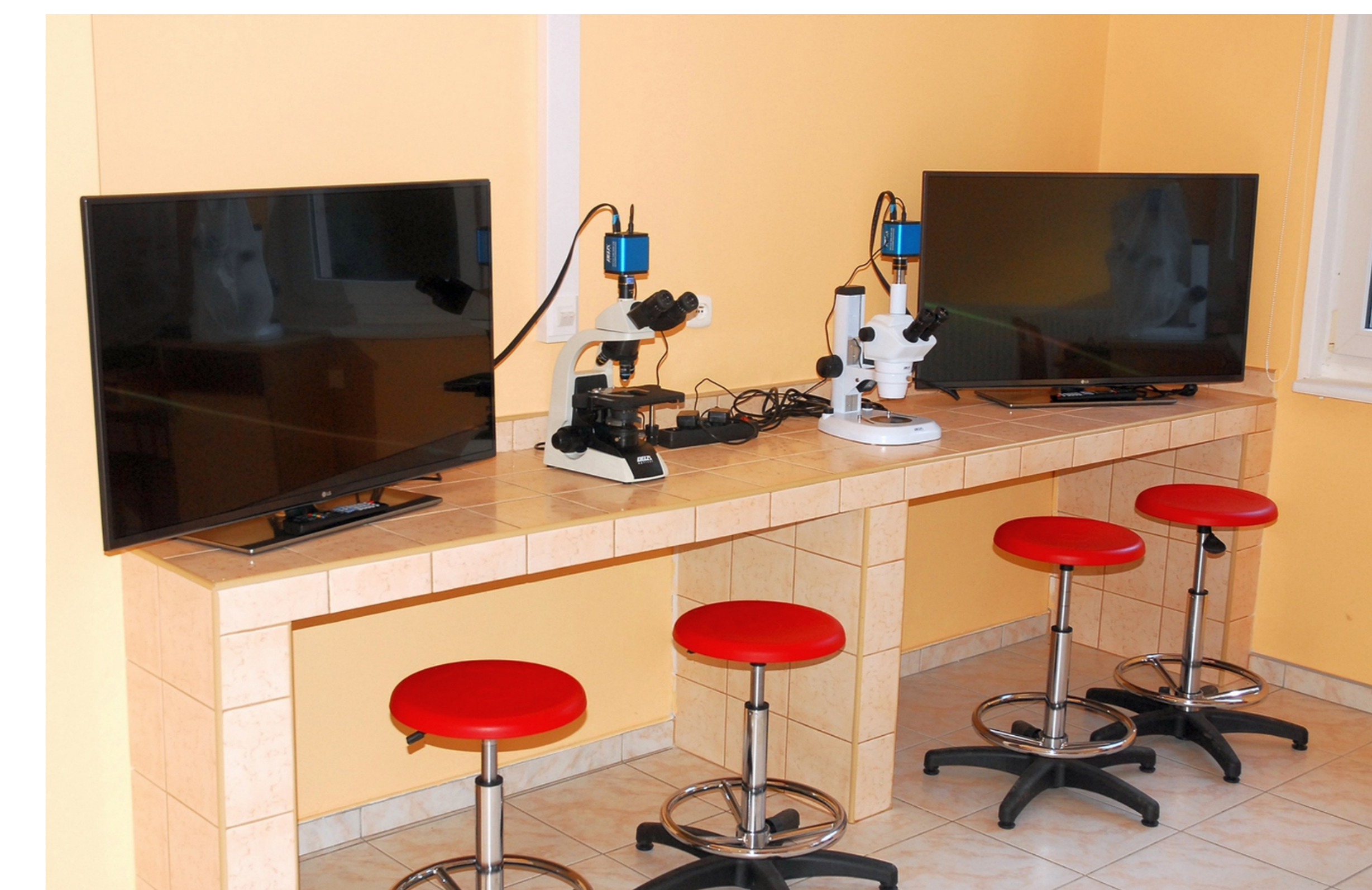
6. Pracownia Bioobrazowania