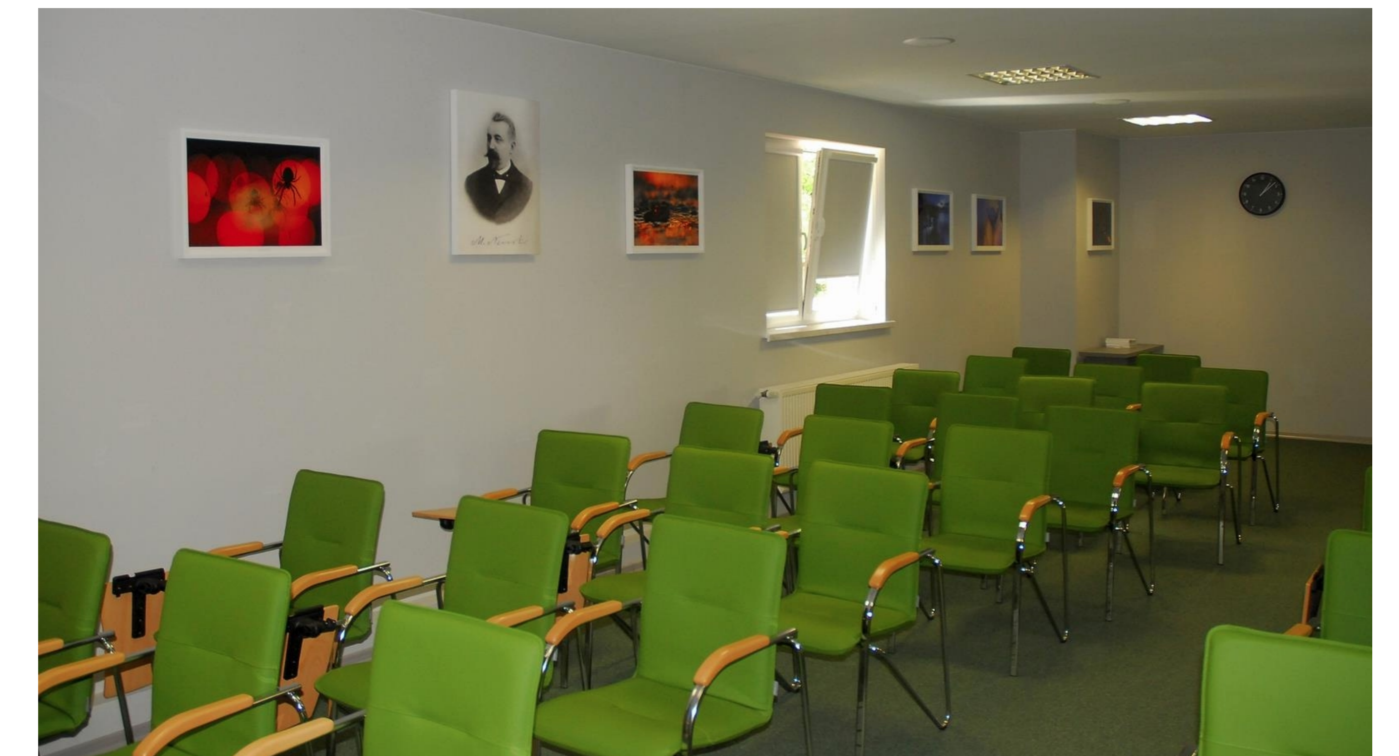
7. Sala wykładowa