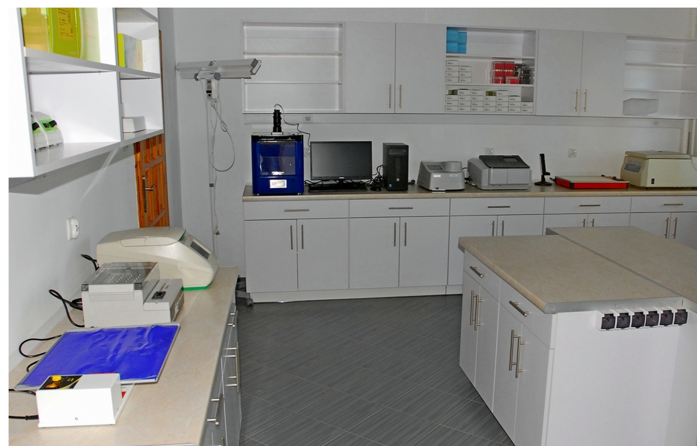
5. Pracownia Ekologii Molekularnej