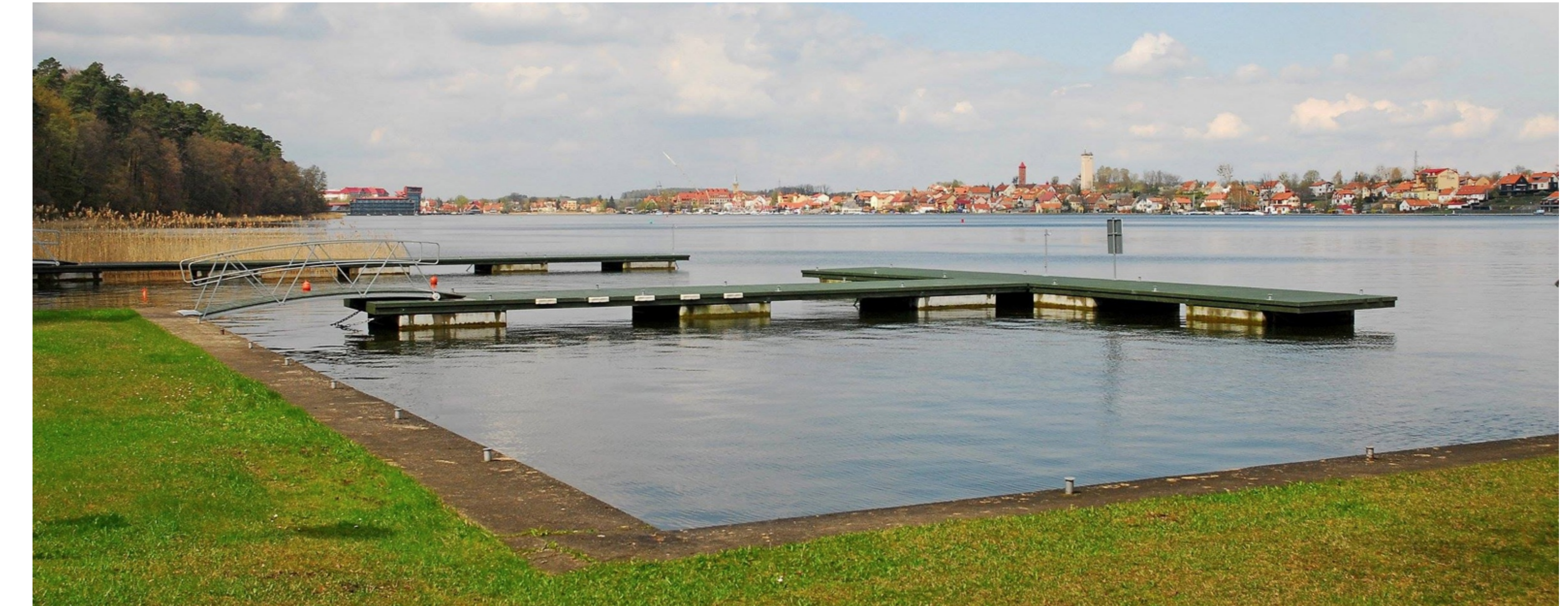
1. Nadbrzeże, port, pomosty